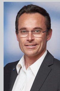
Aus dem Ausschuss Gemeindebetrieb

2021 konnten wir zwei wichtige Projekte umsetzen. Die Gestaltung des Dorfplatzes und das Vorzeigeprojekt Volksschulgarten. Beide Projekte zeichneten sich durch die Einbeziehung von Bürgerinnen und Bürgern aus, deren Wünsche in die Gestaltungen einfließen. Für das Interesse an der Mitarbeit danke ich von Herzen.