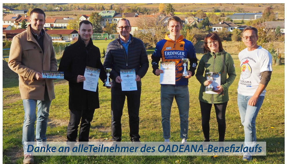
Danke an alle Teilnehmer des OADEANA-Benefizlaufs